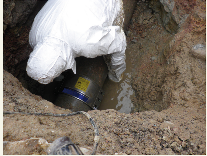
Colocación de abrazadera