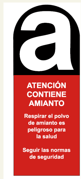
Etiqueta reglamentaria para materiales con amianto

En caso de que no se haya cubierto el suelo de la zona de trabajo, los fragmentos de tubería de fibrocemento, los residuos de amianto y la tierra contaminada así como la ropa de trabajo desechable, guantes, mascarillas desechables, filtros y el resto de material contaminado se recogerán e introducirán en bolsas de plástico de suficiente resistencia mecánica, recomendándose como mínimo 800 galgas de espesor, provistas de cierre hermético. Las bolsas estarán identificadas con la etiqueta reglamentaria.