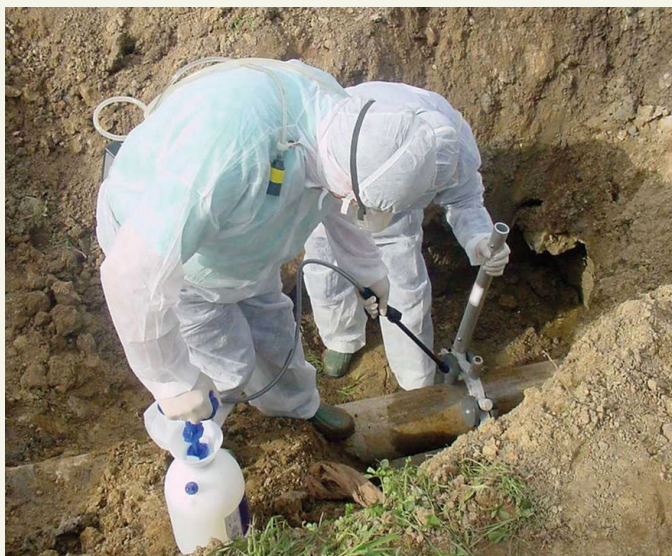
Corte con herramienta manual y aporte de agua

Durante el corte, el trabajador debería adoptar una posición adecuada respecto del viento para que no incidan sobre él las fibras de amianto desprendidas del fibrocemento.