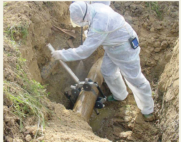
Corte con cortatubos

Aunque la operación de corte de tuberías de fibrocemento dura normalmente poco tiempo, se pueden producir concentraciones elevadas de fibras de amianto que pueden ser inhaladas por el trabajador y dispersarse en el entorno causando exposiciones inadvertidas en otras personas.