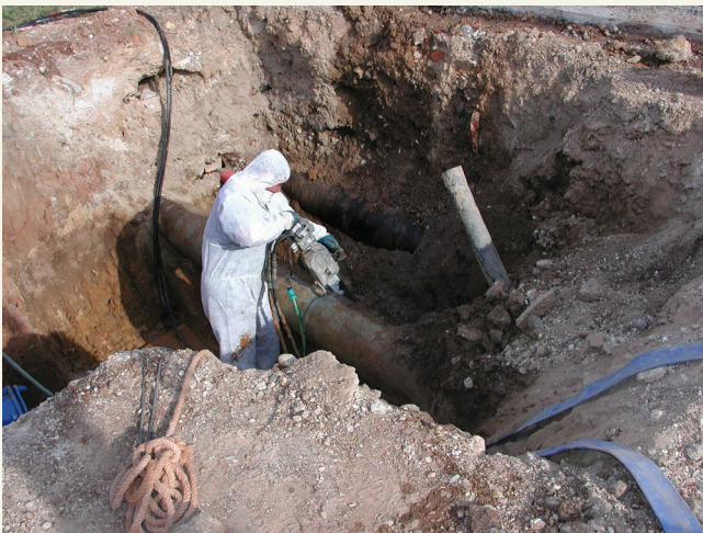
Corte con sierra mecánica

Los trabajos de reparación y mantenimiento se caracterizan frecuentemente por ser de poca duración y no previsible de antemano. Para el corte de las tuberías se utilizan herramientas de diferentes tipos como sierras manuales, sierras mecánicas y cortatubos.