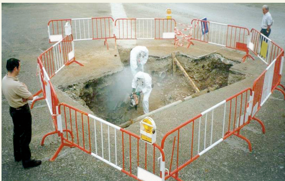
Ejemplo de zona de trabajo mal acotada con riesgo de exposición de otras personas

La zona de trabajo delimita el espacio en el que se puede producir la exposición a fibras de amianto. Se debe señalar por el exterior mediante carteles claros y visibles que adviertan del riesgo de inhalación y de las medidas obligatorias para las personas con acceso a la misma. Se acotará mediante barreras alrededor del punto de corte a una distancia adecuada y solo se debe permitir la entrada al interior de esta zona a personas que deben acceder por razón de su trabajo. Siempre serán el mínimo indispensable de operarios. En esta zona estará prohibido beber, comer y fumar.