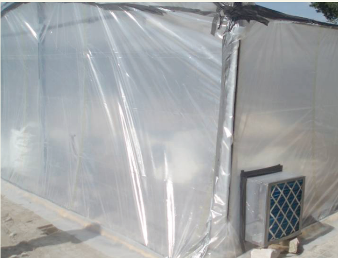
Cubierta de protección para evitar exposiciones inadvertidas

Para facilitar las tareas de limpieza y descontaminación al finalizar las obras, puede ser útil colocar una lona de polietileno u otro material plástico de suficiente resistencia sobre el suelo o superficie de trabajo así como en la zona sobre la que se depositarán los residuos según se vayan generando.