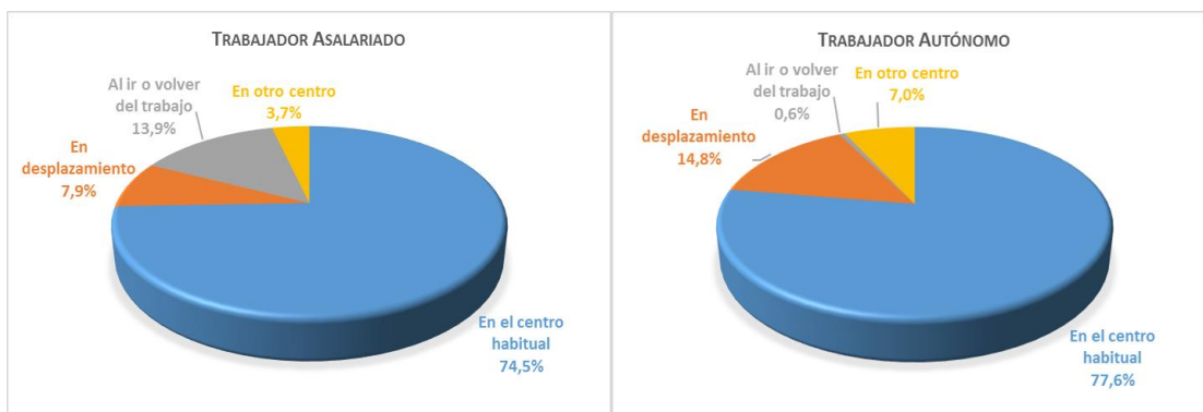
Gráfico 3. Distribución por lugar del accidente: autónomos versus asalariados.